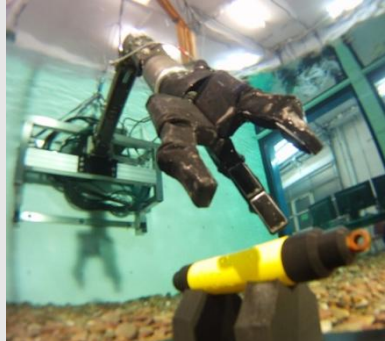
Abb. 2: Das SeeGrip Manipulationssystem am Roboterarm Orion 7P