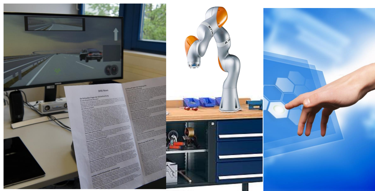
Kontrollübergabe im Fahrzeug und bei MRK, berührungsfreie Gesten

Am Standort Saarbrücken werden ML-Techniken sowohl unter dem Aspekt der multimodalen, proaktiven und situationsbewussten Assistenz und Interaktion mit dem Menschen betrachtet, bei denen diese Techniken unter anderem zum Erlernen adaptiver Verhaltensweisen, zur Vorhersage von Benutzerverhalten oder zur Optimierung von Systementscheidungen und -empfehlungen eingesetzt werden. Diese Interaktion stellt herausfordernde Anwendungsfälle für Machine Learning bereit. So muss die Kontrollübergabe sicher sein und das Vertrauen in die Technik fördern. Lernende Interaktion, Prognoseverfahren im Industriekontext sowie digitale Mensch-Modelle werden als Lerninhalte aufbereitet.