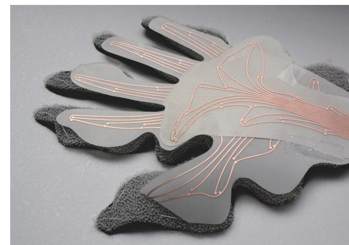
Prototypische Umsetzung von Wearables und IoT

Am Standort Berlin werden mit den Methoden der interdisziplinären und partizipativen Design-Forschung anwendungsnahe Konzepte rund um die Mensch-Maschine-Interaktion mit smarten Textilien und soften Interfaces entwickelt. Die Beteiligten lernen dadurch nicht nur einen nutzerorientierten Entwicklungsprozess kennen, sondern tragen auch aktiv dazu bei, interdisziplinär entstandene Forschungsmuster zur Datenerhebung zu gestalten. Das Berlin Open Lab wird hierfür als Experimentierraum für die neuen Lehr- und Lernformate dienen und eine Reflektion von Wearables und IoT ermöglichen wie auch die Problematik der Datenanalyse und Mustererkennung bei textilen Sensoren thematisieren.