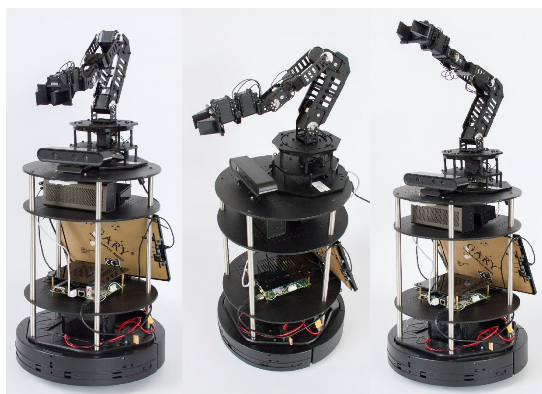
Individualisierte Turtlebot-Systeme für Anwendungen des Langzeitlernens

Am Standort Bremen werden vor allem Fähigkeiten im Bereich Robotik geschult. Eine individualisierte, kommerzielle mobile Plattform wird Sensordaten durch ML-Verfahren verarbeiten und entsprechend sein Verhalten anpassen. Die erarbeiteten Konzepte und Grundlagen können anwendungsnah im Produktionsszenario mit industriellen Manipulatoren evaluiert werden. Zentrale Themen sind Verhaltensoptimierung durch ML, Langzeitautonomie durch flexible ML-Verfahren, Selbstevaluation und -regulation, Test und Evaluation von Lernverfahren auf den mobil-autonomen Systemen. Hierbei soll den Systemen größtmögliche Autonomie (Explorationsverhalten) bei der Ausübung von Verhalten (Greifmanipulationen) überlassen werden.