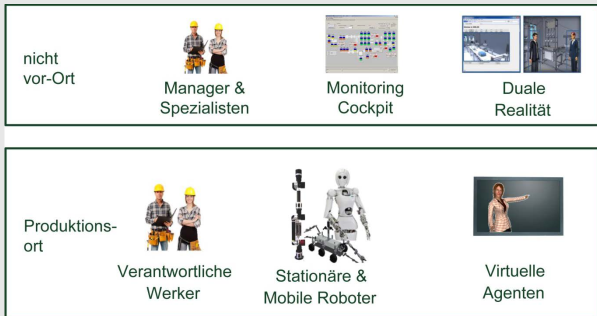
Komponenten von HySociaTea

Hybrid Social Teams for Long-Term Collaboration in Cyber-Physical Environments